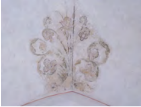
Bloemmotief in de Grote Kerk van Epe

In de Grote Kerk zien we dat 'moderne' kennis en techniek als perspectief nog nauwelijks is toegepast in de gewelfschilderingen uit de 16e eeuw. In de Lebuïnuskerk in Deventer (zie de foto's hieronder) is deze toepassing al wel te zien.