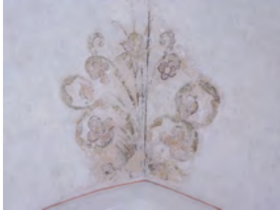
Foto van een bloemmotief uit de zestiende eeuw, zoals te zien in het koor.

Nog niet zo lang geleden zouden deze recente schilderingen zijn verwijderd om de oudere lagen bloot te leggen. Tegenwoordig zien we in dit recentere werk wel een historische waarde.