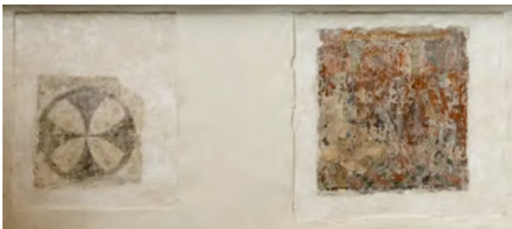
Links op de foto één van de twee wijdingskruisen in het koor, rechts de geseling van Christus.

Bij de restauratie van 1962 werden in de Grote Kerk twee wijdingskruisen (25 en 26) ontdekt. Wanneer de Grote Kerk van Epe precies gewijd werd is niet zeker. Waarschijnlijk gebeurde dit tussen de bouw van het koor en de uiteindelijke voltooiing van de kerk. Dit situeert de kruisen ergens tussen het einde van de 14e eeuw en rond 1415 toen de verhoging van de toren werd voltooid.