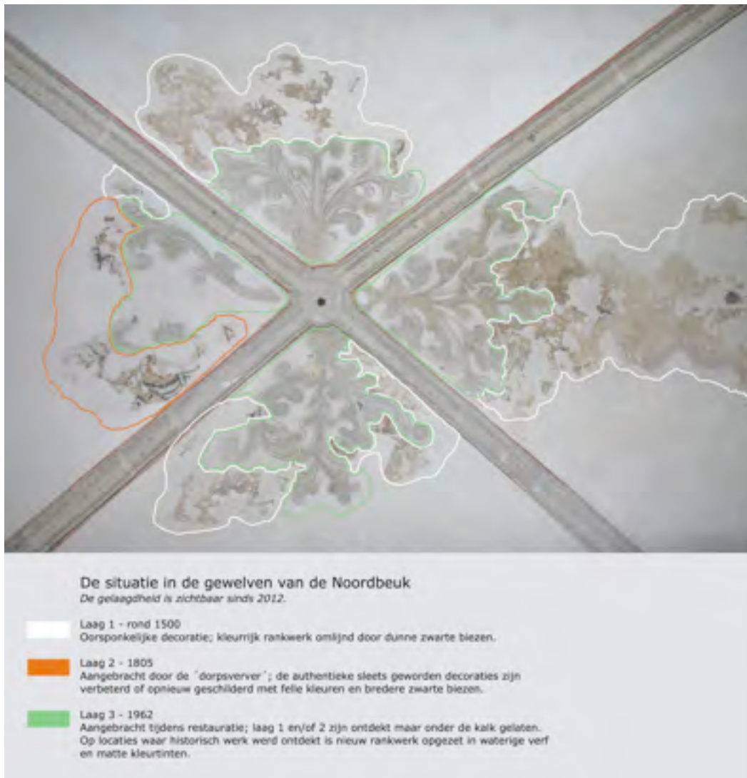
Foto van de laatste travee Noordelijke zijbeuk.

De drie schilderperiodes zijn hier moeilijk uit elkaar te houden, vandaar de toelichtende kleuren.