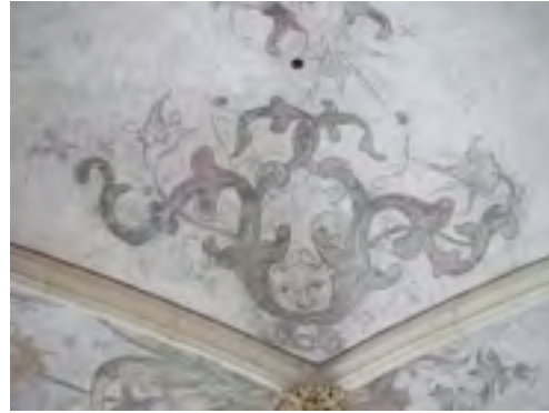
Een complexer bloemmotief in de Lebuïnuskerk in Deventer