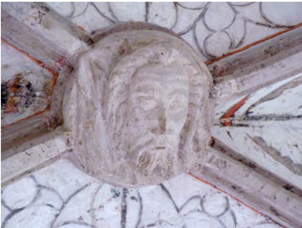
Foto van gewelfsteen in het koor, met Christuskop tussen bloemmotieven uit verschillende perioden.

In de Grote Kerk waren op de muren en pilaren bijbelse taferelen te zien afgewisseld met afbeeldingen van heiligen. Naar boven kijkend vangen we een glimp op van het paradijs met in het koor als centraal punt de gewelfsteen met de Christuskop (18) die naar beneden kijkt.