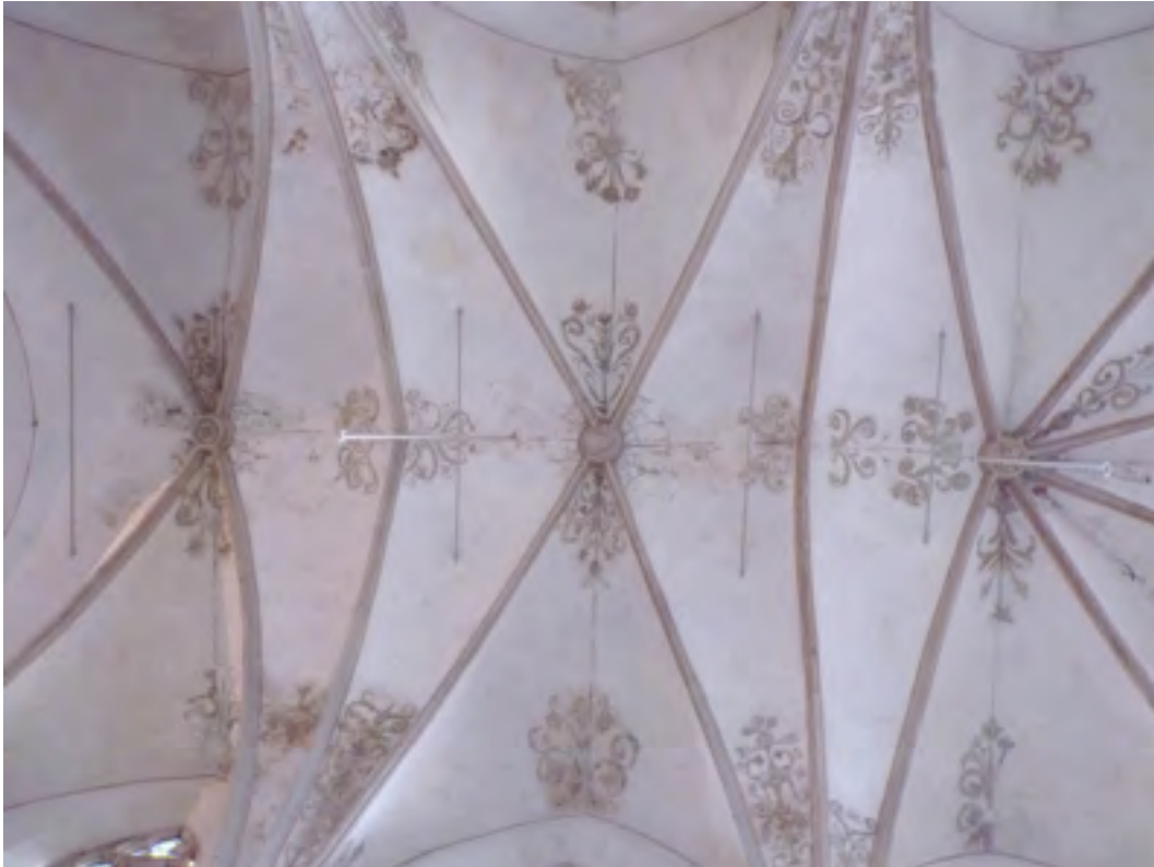
Foto van het koorgewelf in 2012 met daarin de verschillende schilderperiodes. Op deze plek is nog het best zichtbaar hoe de gewelven er waarschijnlijk ooit uitzagen.

In de gewelven van het koor, het schip en de zijbeuken zijn schilderijen van bloemen, bladeren, vazen, dierfiguren en een ridder te zien. De oudste schilderijen uit de 16e eeuw zijn in de 19e en de 20e eeuw aangevuld of overgeschilderd. Deze drie periodes zijn duidelijk van elkaar te onderscheiden, al lopen ze soms ook door elkaar heen.