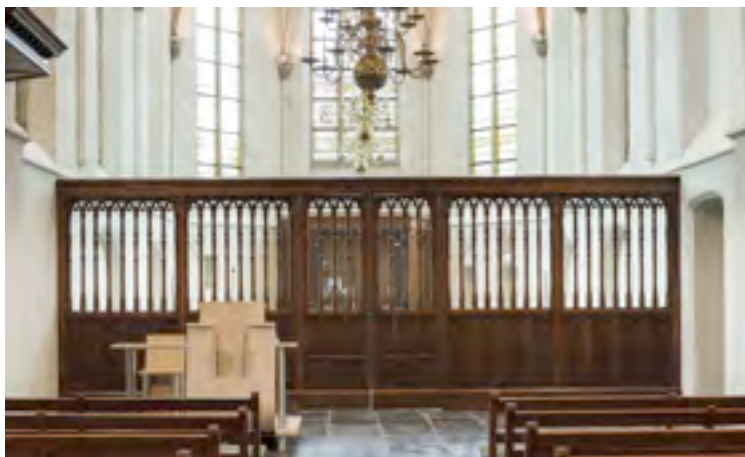
Het oude koorhek in de Grote Kerk stamt uit 1525.

In 1805 werd het oude koorhek ( 20 ) vervangen door een nieuwe. Het oude hek werd in tweeën gedeeld en gebruikt als afscheiding tussen de zijbeuken en de ruimten naast de toren. De noordelijke ruimte ( 1 ) gaf toegang naar het orgel en de zuidelijke ruimte ( 2 ) was de vroegere catechisatiekamer, die nu als consistorie wordt gebruikt.